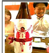
下堂蘭前会長 お疲れさまでした