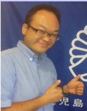
鹿児島東倫理法人会 現在総会員数 104社